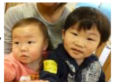
〈お話を伺った 上原さんのお子さんたち〉

4月から保育園に入りましたが、なかなか馴染めず「ほっとる一むに行きたい」と言っています。(笑)「ほっとる一む」という言葉の通り、温かくて安心できて、すてきな場所を下さり本当にありがとうございます！