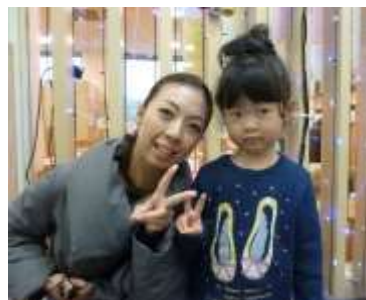
<小野田さんとお子さん>