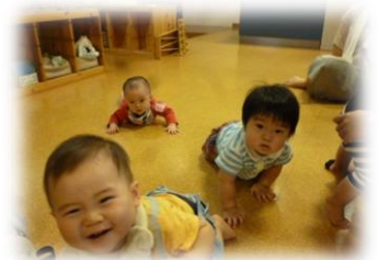
ママスタッフ大活躍！ぐるぐるリサイクル