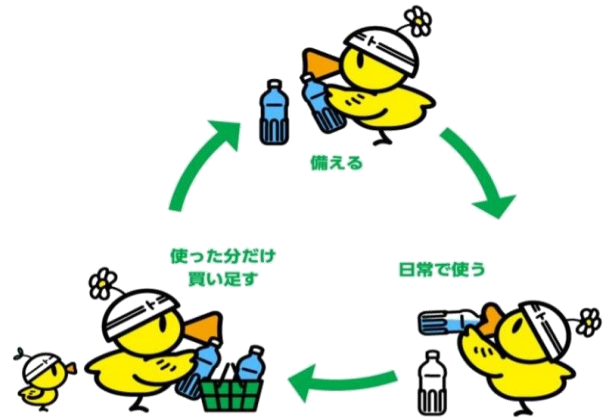
ローリングストックの図

ローリングストックとは、ストック(備蓄)をローリング(回転)することです。災害時に備えておきたい非常食の目安は、3日以上できれば1週間分と言われていています。日常的に消費する食品を多めに購入し、使ったら使った分だけ新しく買い足していくことで、常に一定量の食品を備蓄しておく方法をローリングストックと言います。