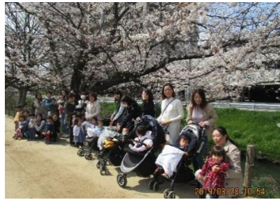
【昨年のおさんぽの様子】