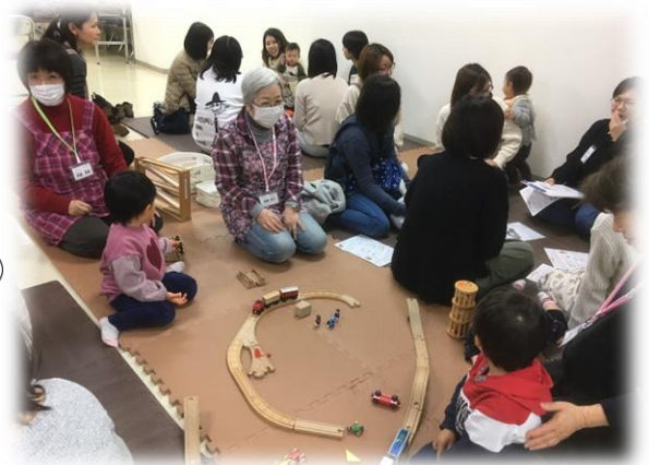
保育園ママ交流会

松戸市地域子ども・子育て支援事業 松戸市乳幼児一時預かり事業 松戸市子育てコーディネーター事業