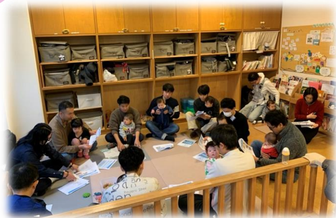
おとうさんひろば